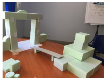
Most łączący Pałac Kultury Zagłębia z Fabryką Pełną Życia