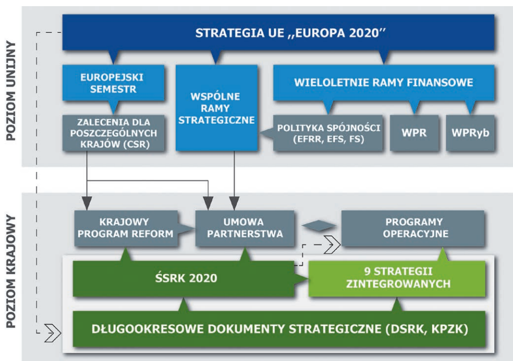
Schemat 2. Zależności i powiązania między dokumentami krajowymi i unijnymi

Efektywne wykorzystanie środków EFSI jest jednym z kluczowych warunków realizacji celów rozwojowych kraju, dla których w latach 2014–2020 fundusze europejskie stanowiąc będą istotne, ale nie jedyne źródło finansowania. Szacuje się, że w latach 2014–2020, ze środków unijnych zostanie sfinansowanych ok. 1/3 wydatków rozwojowych kraju.