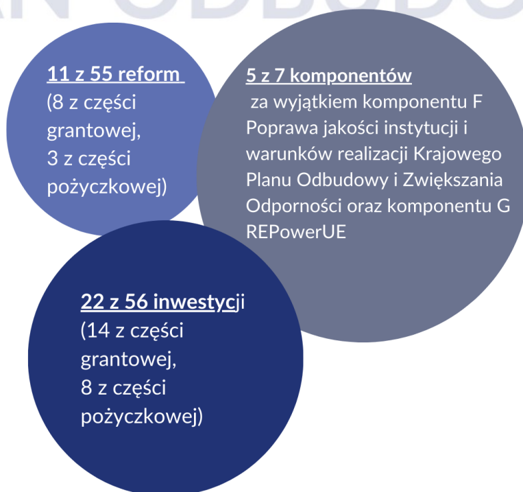
Rys.1 Zakres zmian II rewizji KPO na podstawie projektu z 15 marca 2024 r.

Zaproponowane zmiany w KPO prezentują się jak na poniższej infografice i objęły: