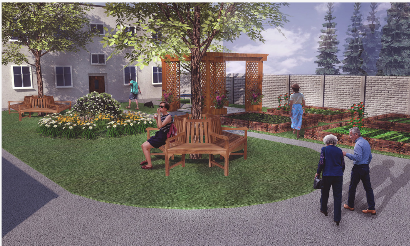
Wizualizacja, Oktawia Mikula

Miasta, które w przyszłości będą myślały o przeprowadzeniu podobnych projektów powinny pamiętać by być elastycznym i dawać wykonawcy możliwość dostosowania projektu do rzeczywistego zaangażowania beneficjentów. Nie wiedząc jakie są potrzeby mieszkańców i jakie przeobrażenia będą miały miejsca – niezwykle istotnym jest, aby każda zmiana w projekcie została przedyskutowana wszystkie zaangażowane strony i wspólnie ustalono nowy harmonogram projektu.