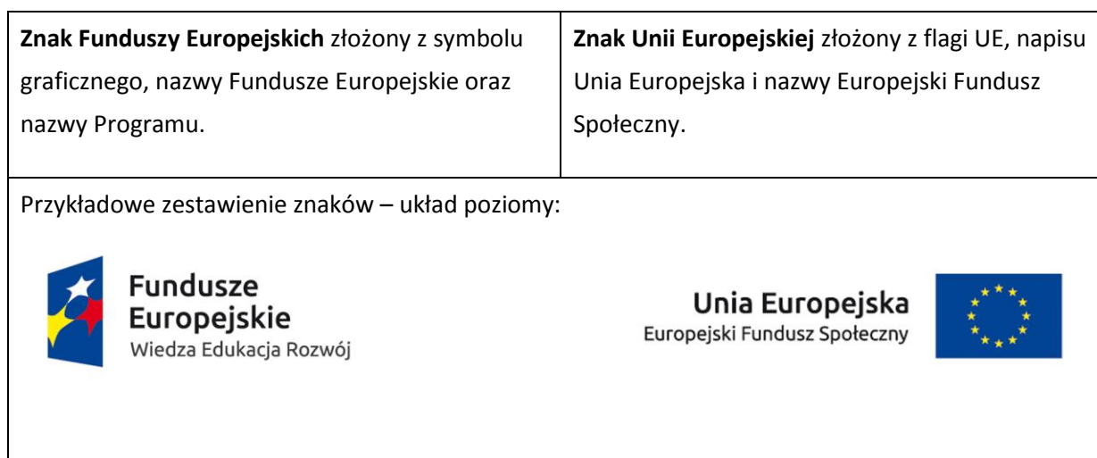
Tabela 8 Znaki, które musi zawierać każdy wymieniony wyżej element.

Zestawienia logotypów są dostępne na stronie internetowej Instytucji Pośredniczącej i Instytucji Zarządzającej: power.gov.pl . Znajdziesz tam także gotowe wzory dla plakatów i tablic, z których powinieneś skorzystać.