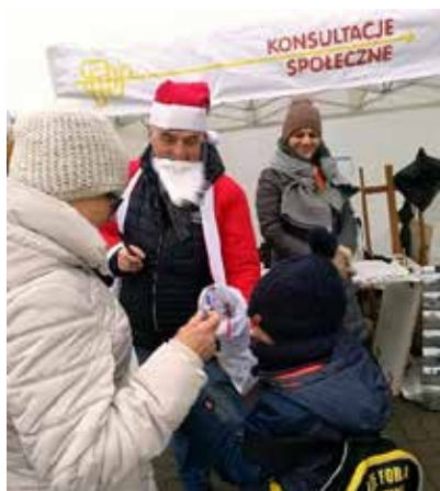
Terenowy punkt konsultacyjny w trakcie konsultacji społecznych dot. bazaru Rogatka

Spośród wszystkich zastosowanych form konsultacji największym zainteresowaniem cieszyły się punkty informacyjne i prezentowane na nich materiały: plansze, plakaty, namiot konsultacyjny oraz atrakcje. Elementami przyciągającymi mieszkańców były także drobne atrakcje oferowane przez Wykonawcę: rozdawanie cukierków na stoisku czy mikołajkowe przebranie (czapka św. Mikołaja), gdy punkt konsultacyjny wypadł w Mikołajki.