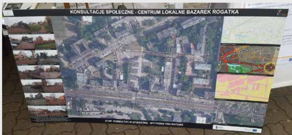
Plansza informacyjna prezentowana podczas konsultacji

W przypadku przeprowadzonych działań dotyczących dawnego bazaru Rogatka działania informacyjne zaplanowano w następujący sposób.