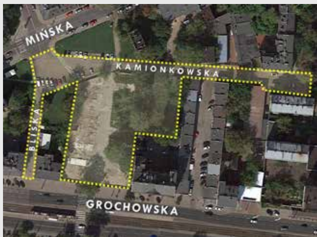
Obszar szerszy – plan dawnego targowiska wraz z ul. Kamionkowską zamieszczony w raporcie z konsultacji

Dużo uwagi poświęcono na ustalenie dokładnego zakresu konsultacji oraz zasięgu opracowania. W tym celu władze dzielnicy prowadziły jednocześnie rozmowy z urzędnikami reprezentującymi poszczególne biura i jednostki, jak również z przedstawicielami rady osiedla Kamionek, którzy od początku zaangażowali się w działania rewitalizacyjne na rzecz Kamionka. Z uwagi na zgłoszenia mieszkańców dotyczące przywrócenia funkcji handlowej na bazarze prowadzono także wstępne rozmowy z potencjalnymi operatorami