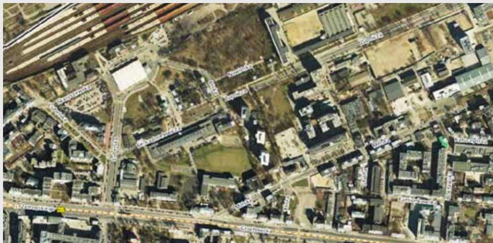
Kwartał ulic w okolicy dawnego targowiska, w obrębie których prowadzona była akcja informacyjna (ulotki, plakaty, banery)

Identyfikacja interesariuszy prowadzona była dwutorowo. Przed rozpoczęciem procesu pomysł utworzenia centrum lokalnego na terenie dawnego bazaru został przedstawiony radzie osiedla Kamionek. Z uwagi na likwidację targowiska główną zidentyfikowaną grupą odbiorców usług i użytkowników przyszłego centrum byli okoliczni mieszkańcy oraz potencjalni użytkownicy miejsca, osoby pracujące, uczące się w najbliższej okolicy. Po wyborze wykonawcy procesu konsultacji przygotowano listę potencjalnych grup odbiorców, do których kierowana była informacja o konsultacjach, tj. organizacji pozarządowych (za pośrednictwem Dzielnicowej Komisji Dialogu Społecznego), spółdzielni i wspólnot mieszkaniowych, mieszkańców lokali komunalnych, lokali usługowych zlokalizowanych w najbliższej okolicy oraz szkół, przedszkoli, bibliotek i centrum kultury.