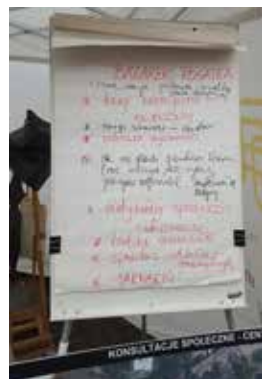
Terenowy punkt konsultacyjny w trakcie konsultacji społecznych dot. bazaru Rogatka