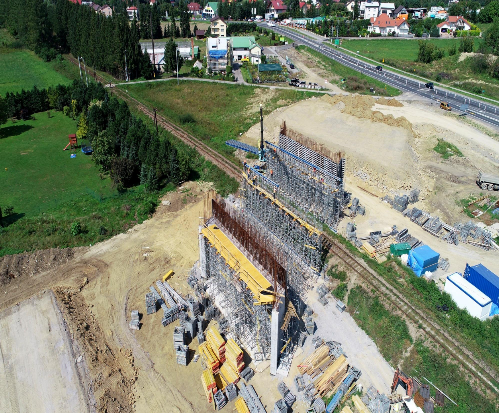
Budowa obwodnicy Sanoka w ciągu drogi krajowej 28