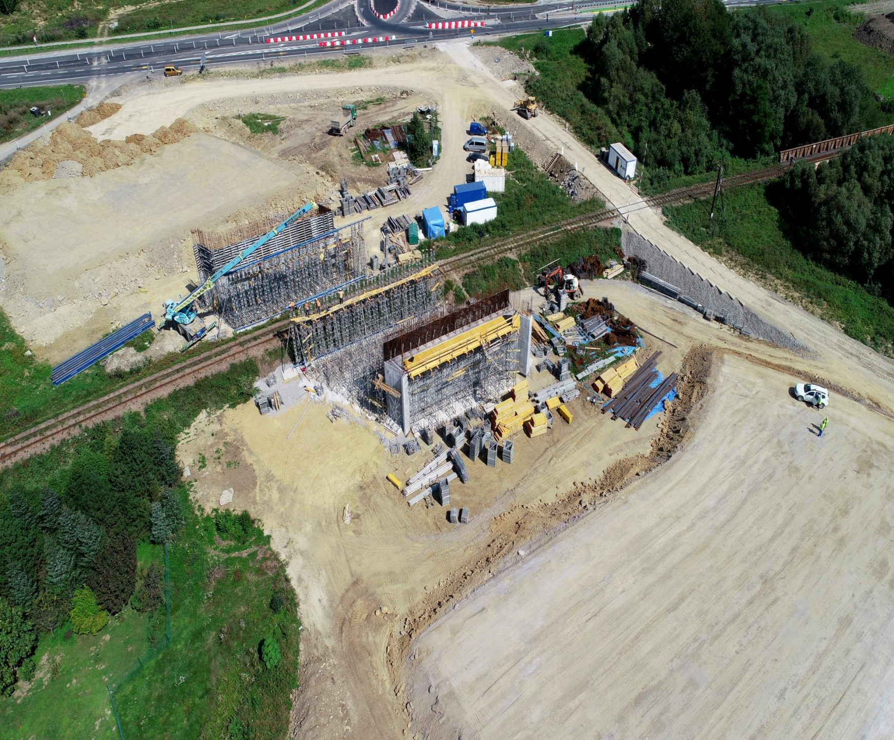
Budowa obwodnicy Sanoka w ciągu drogi krajowej 28