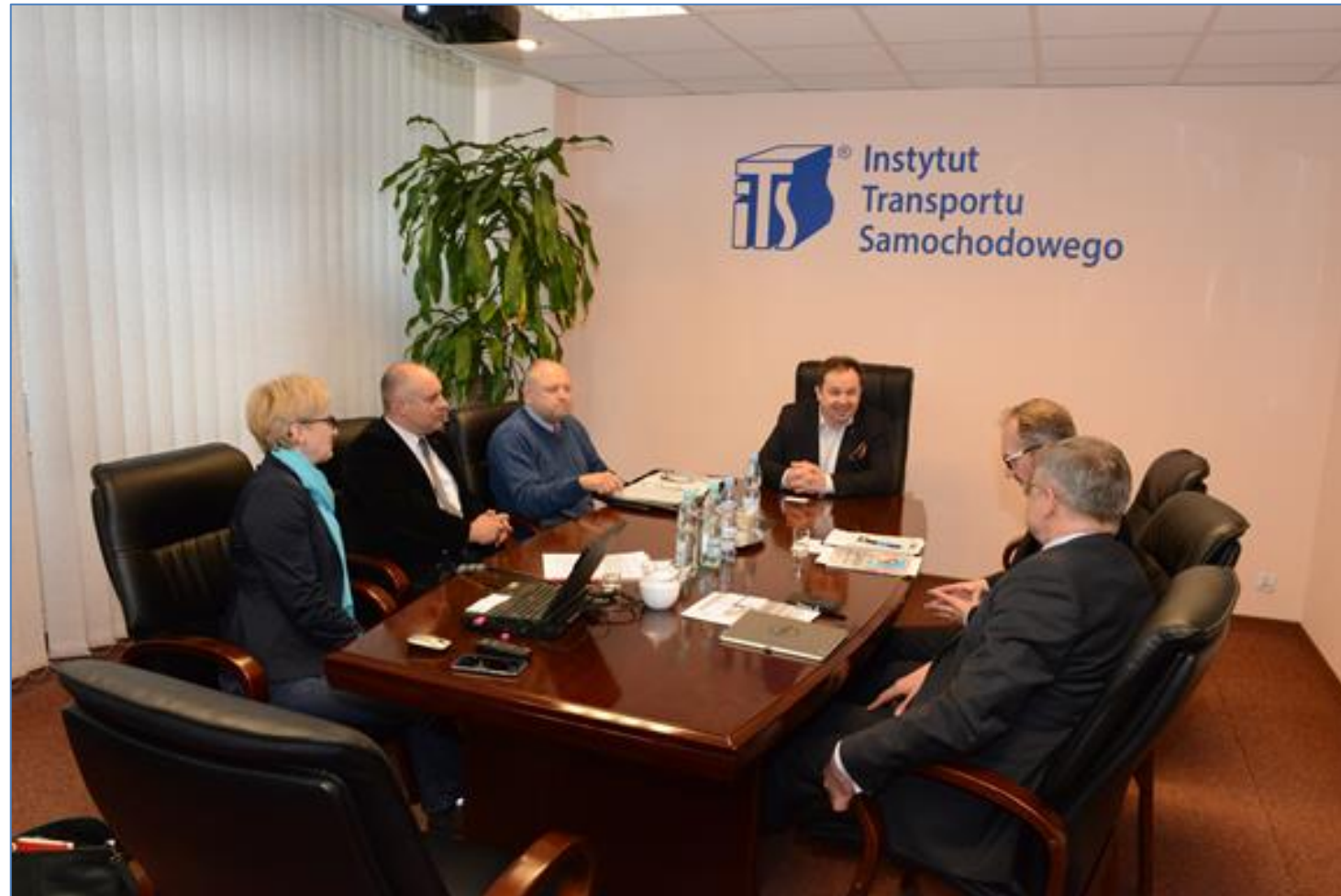
Fotorelacja ze spotkań w których uczestniczyli Dyrektor i pracownicy ITS dotyczące działań na rzecz mobilności osób z niepełnosprawnościami

Instytut Transportu Samochodowego widząc i rozumiejąc potrzeby osób z niepełnosprawnościami, a także istotę tworzenia transportu świadomego społecznie podejmuje współpracę z wieloma podmiotami i instytucjami zainteresowanymi tematyką motoryzacji tej grupy społecznej.