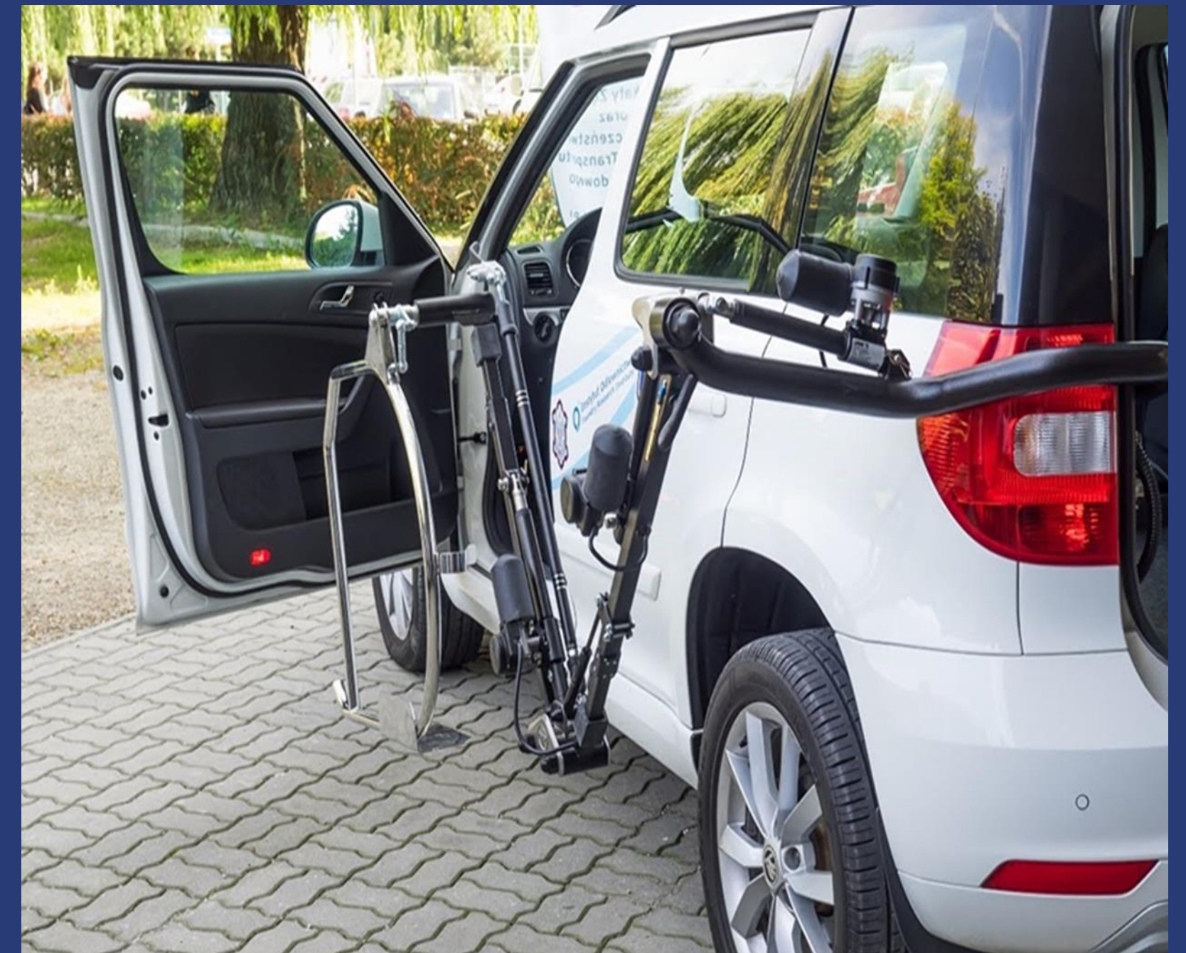
Samochód dla kierowcy z niepełnosprawnościami należący do floty pojazdów ITS