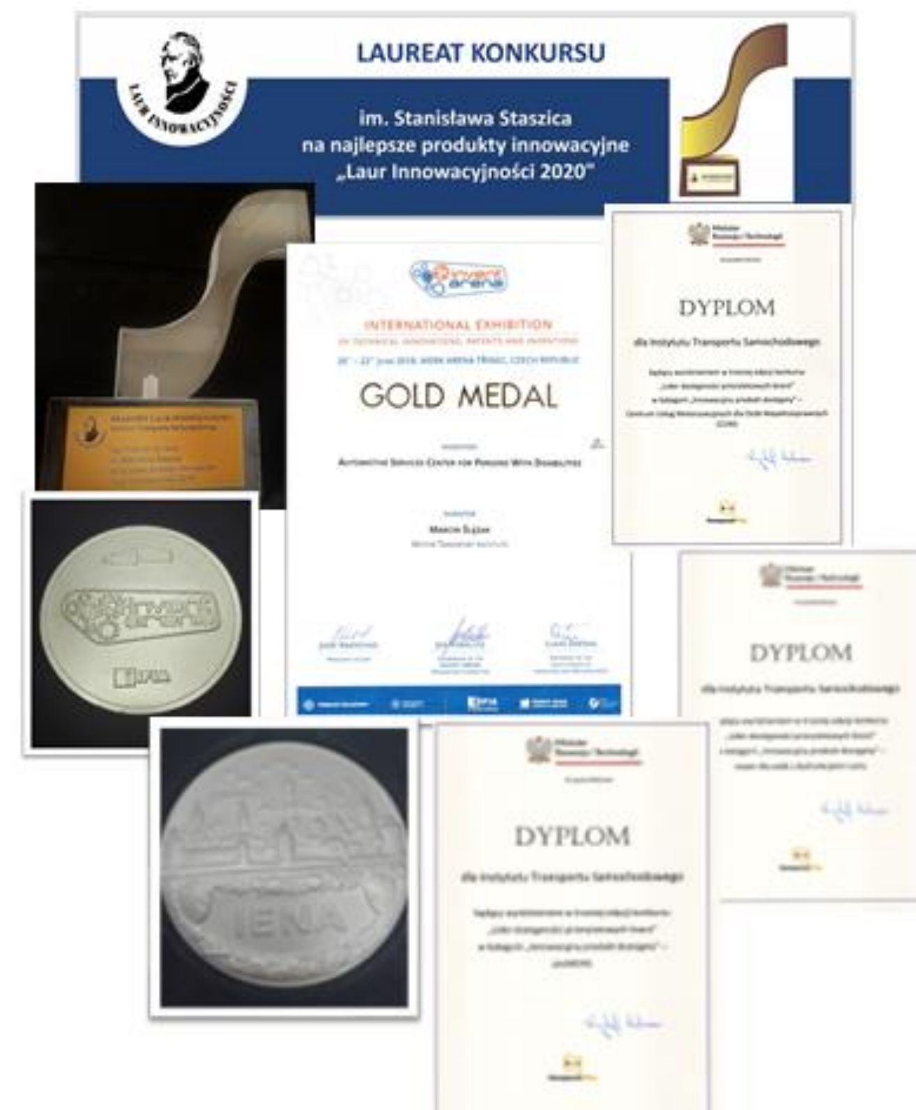
Nagrody i osiągnięcia

Instytutu Transportu Samochodowego w Warszawie w ramach działań wspierających osoby z niepełnosprawnościami