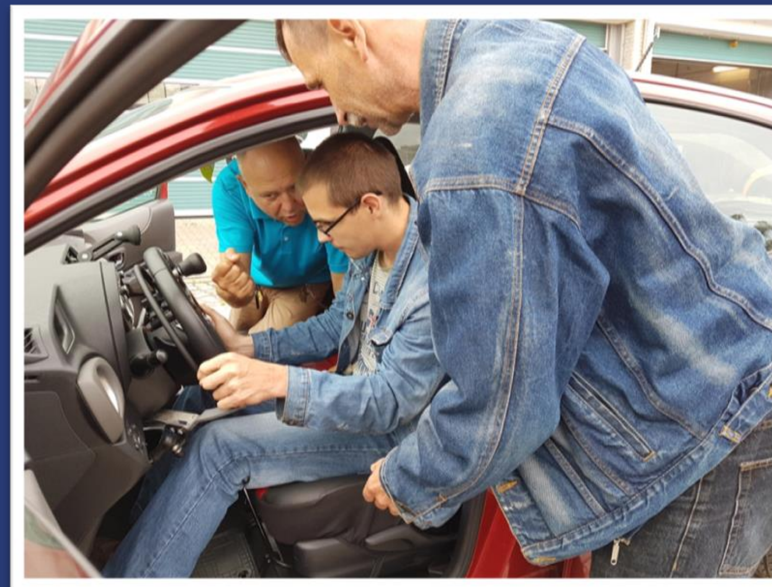
Zdjęcie z przymiarki urządzeń adaptacyjnych dla kierowcy z niepełnosprawnościami