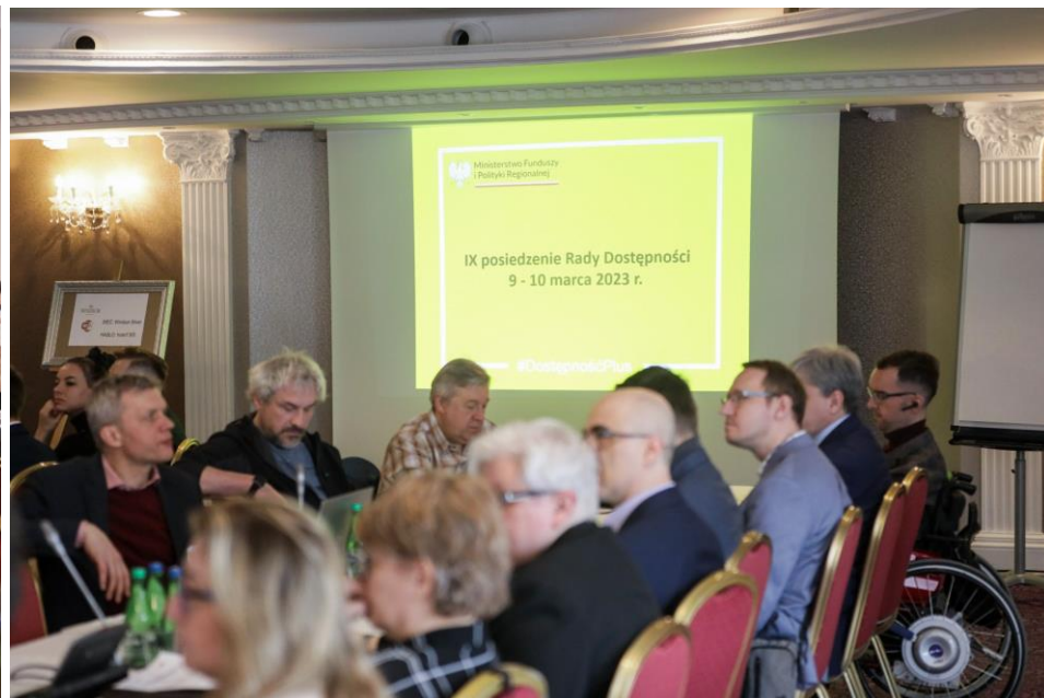
Posiedzenie Rady Dostępności w Jachrance (10 marca 2023 r.)