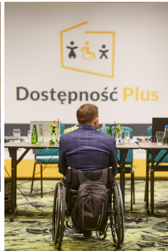
Posiedzenie Rady Dostępności w Jeleniej Górze