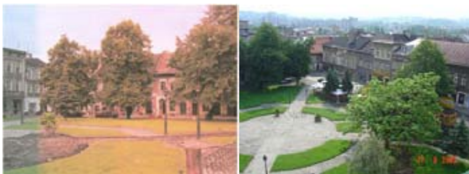
Ryc. 13 Rynek Starego Miasta w Bielsku-Białej przed modernizacją I (fot. Um.bielsko.pl)

Obecnie rynek otoczony jest zabytkowymi barkowo-klasycystycznymi kamieniczkami pochodzącymi z XVII, XVIII i XIX w., które sukcesywnie dzięki staraniom władz miasta, lokalnych inwestorów i gestorów są odnawiane. 16