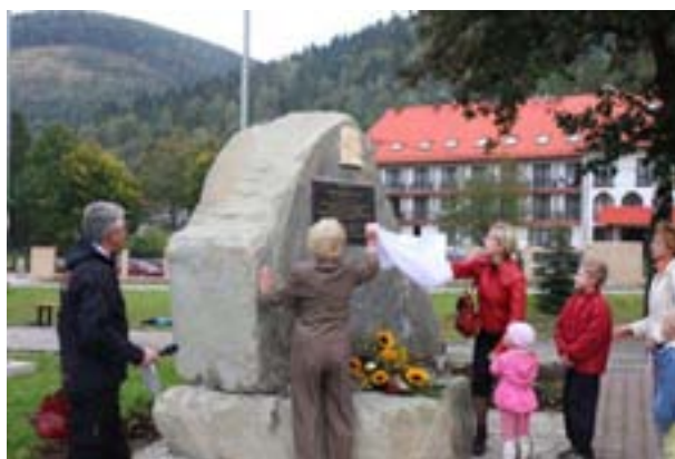
Ryc. 29 Uroczyste otwarcie szlaku im. Stanisława Huli ( 1.11.2010)