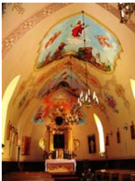
Ryc. 32 Kamesznica – kaplica MB Szkaplerznej

Po dwóch godzinach dochodzimy do niewielkiej miejscowości Kamesznica, w której możemy zobaczyć zespół zabudowań dworskich rodu Potockich z wyróżniającą się kaplicą Matki Bożej Szkaplerznej ( Ryc. 32 ) oraz park dworski w stylu angielskim z cennym i starym drzewostanem. Następnie korzystając z usług prywatnego lub państwowego przewoźnika udajemy się bussem albo autobusem do Żywca, a właściwie nasze zwiedzanie rozpoczynamy od założonego w 1856 r. przez Arcyksięcia Albrechta Fryderyka Habsburga Browaru Książęcego. W jego najstarszej części obecnie mieści się jedno z najnowocześniejszych muzeów tego typu w Polsce.