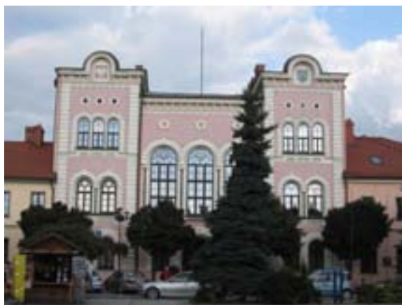
Ryc. 46 Ratusz w Żywcu

Teraz zmierzamy na Rynek, gdzie na pierwszy plan wysuwa się Ratusz z namalowanymi na froncie dwoma herbami: Polski i Żywca ( Ryc. 46 ). Obecnie swoją siedzibę mają tu władze samorządowe. Stąd, codziennie o godzinie dwunastej rozlega się wspaniale brzmiący hejnał żywiecki, grany w pierwszej części na trąbce, w drugiej na pasterskich trąbitach. Po środku rynku mieści się fontanna z posągami św. Floriana.