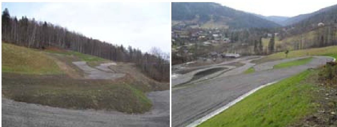
Ryc. 25 Centrum Rekreacji w Szczyrku – stan po zakończeniu projektu I

Dzięki tej inwestycji Szczyrk wzbogacił się o kolejną atrakcję przyciągającą nową grupę turystów- spragnionych adrenaliny fanów crossu. Jednocześnie przedłużono w ten sposób sezon turystyczny o kolejne miesiące. Sytuacja ta jest również niezwykle korzystna dla mieszkańców, ponieważ większość z nich utrzymuje się głównie z turystyki, zatem zwiększona liczba turystów wpłynie na zwiększenie dochodów, a te poprawią jakość życia mieszkańców.