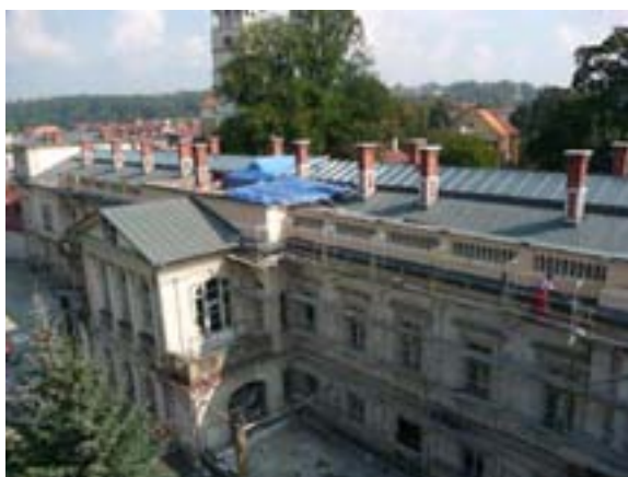
Ryc. 43 Remont budynku Nowego Zamku I etap

W tym czasie wymieniono więźbę dachową i zamontowano blachę tytanową ( Ryc. 43 ), wykonano izolację pionową oraz dokonano odwodnienia obiektu.