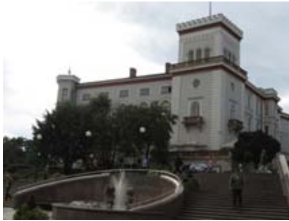
Ryc. 7 Zamek Sulkowskich

archeologiczną, Etnograficzną, Zbrojownię i Pokój myśliwski, Salon muzyczny, Wystawę Sztuki XIV-XVII w., Galerię malarstwa XIX i XX w., Gabinet Pana, Damski, Salonik i Lapidarium.