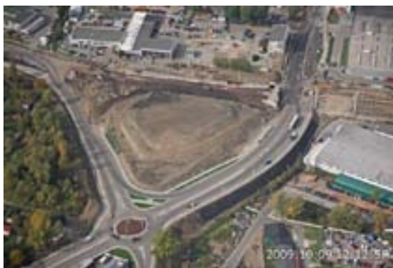
Ryc. 2 Widok z lotu ptaka na modernizowaną drogę krajową nr 52

Ze względu na swoje atrakcyjne położenie Bielsko-Biała stanowi doskonałą bazę wypadową dla turystów uprawiających różne formy aktywności: pieszej, rowerowej, narciarskiej oraz bardziej ekstremalnej, jak wspinanie czy latanie.