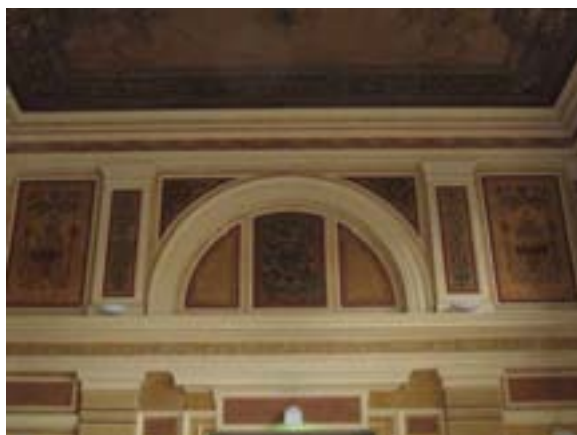
Ryc. 6 Dworzec Główny PKP

Początek trasy znajduje się na niedawno odrestaurowanym Dworcu Głównym PKP Bielsko-Biała. Budynek powstał w 1890 r. i przykuwa uwagę niezwykle malowniczymi dekoracjami znajdującymi się we wnętrzu ( Ryc. 6 ). Stąd kierujemy się na południe ulicą 3 Maja, oglądając po zachodniej stronie zabytkowe kamienice z przełomu XIX i XX wieku. Następnie po lewej (wschodniej) stronie, tuż nad wlotem tunelu kolejowego znajduje się reprezentacyjny neorenesansowy Hotel „Prezydent”, nazwany pierwotnie „Kaiserhof”, w 1922 r. na cześć pierwszego w niepodległej Polsce wybranego prezydenta Gabriela Narutowicza zmienił nazwę na „Prezydent”. 8