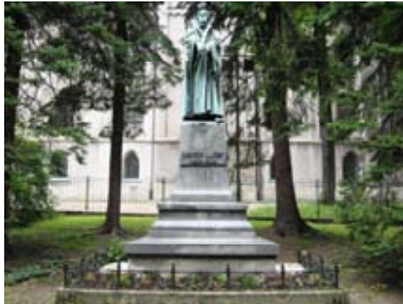
Ryc. 17 Pomnik Marcina Lutra

całości składa się ze schodów i prowadzi między ścianą zamku a bocznymi elewacjami kamienic do ul. 3 Maja.