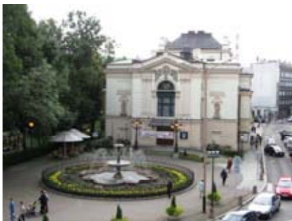
Ryc. 10 Teatr Polski w Bielsku-Białej stan obecny

kulturalnej w mieście, co w założeniu ma przyczynić się do pogłębienia rozwoju społecznego miasta i zwiększenia jego konkurencyjności w regionie. 13