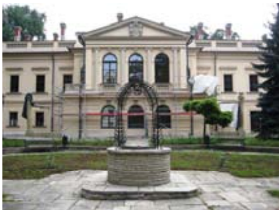
Ryc. 42 Palac Habsburgów w Żywcu

Prace w ramach projektu zostały podzielone na kilka etapów. Pierwszy obejmował Remont budynku Nowego Zamku i został zrealizowany w okresie 16.04.-15.11.2009 r.