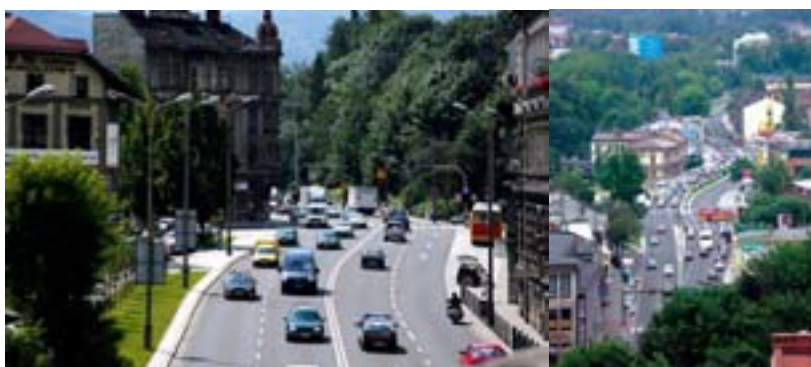
Ryc. 1 Inwestycje drogowe w Bielsku-Białej