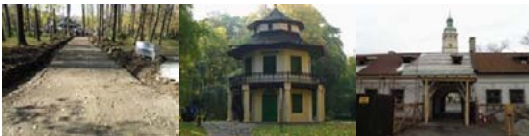
Ryc. 36 Rewitalizacja kompleksu Starego Zamku i Parku Habsburgów w Żywcu I