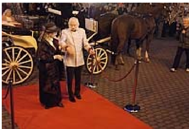
Ryc. 9. Cesarz Franciszek Józef z Księżniczką Sisi

Po opuszczeniu muzeum warto przespacerować się dookoła budowli, aby obejrzeć roztaczającą się wokół panoramę. Na wprost widać gmach poczty z 1898 r., z prawej szczyt Szyndzielni a z lewej odrestaurowany budynek wzniesionego w 1890 roku Teatru Polskiego z umieszczonymi na fasadzie motywami rzymskimi ( Ryc. 10 ) który w październiku 2010 roku zainaugurował 120 sezon artystyczny. Temu jubileuszowemu wydarzeniu towarzyszyły akompaniamenty orkiestry dętej oraz ciekawa inscenizacja przygotowana przez artystów, m.in., wcielili się oni w historyczne postacie- Cesarza Franciszka Józefa i Księżniczkę Sisi ( Ryc. 9 ). 11