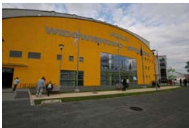
Ryc. 22 Hala wielofunkcyjna w Bielsku-Białej

My jednak korzystając z pięknej pogody i będąc pełnymi zapału wspinamy się na szczyt, podziwiając przy tym otaczający nas krajobraz i wsłuchując się w otaczającą nas przyrodę. Wreszcie po godzinnym marszu na horyzoncie wyłania się schronisko PTTK na Szyndzielni (1026 m n.p.m.). W środku możemy się posilić i napić,