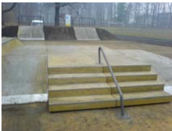
Ryc. 39 Rolkowisko w Żywcu

W ten sposób rozszerzono ofertę turystyczną miasta, a przede wszystkim zrealizowano długofalową politykę dbałości o rozwój dzieci i młodzieży i jednocześnie poprawiono jakość życia mieszkańców. Zniknął bowiem problem nudzącej się pod blokiem młodzieży.