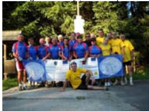
Ryc. 4 Uczestnicy rajdu z okazji otwarcia szlaku