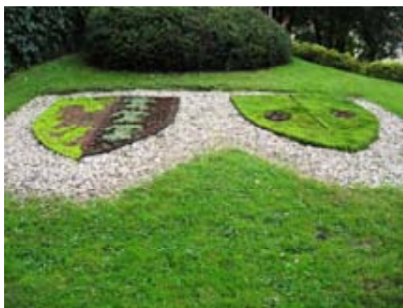
Ryc. 12 Herb Bielska-Białej

Na murawie nieopodal obelisku znajduje się niezwykle ciekawe przedstawienie herbu (Ryc. 12) Bielska-Białej .