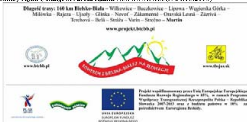
Ryc. 5 Tablica informacyjna z opisem szlaku