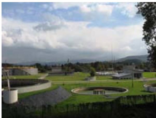
Ryc. 47 Nowoczesna oczyszczalnia ścieków w Żywcu

Inwestycja ta w znacznym stopniu wpłynęła na poprawę jakości życia mieszkańców, a także na jakość pobytu turystów. Dzięki poprawie jakości zarządzania gospodarką ściekową i dostosowaniu jej do obowiązujących dyrektyw unijnych ograniczono odprowadzanie ścieków bezpośrednio do wód powierzchniowych, podziemnych oraz gleby, co również bezpośrednio przyczynia się do zachowania w stanie naturalnym Żywieckiego Parku Krajobrazowego. Teraz możemy wrócić tą samą drogą lub ulicą Sienkiewicza na Rynek a dalej ulicą Stefana Batorego, a następnie ul. Dworcową do punktu końcowego naszego szlaku, dworca PKP.