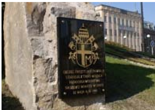
Ryc. 11 Obelisk upamiętniający wizytę Jana Pawła II w BB

Na murawie nieopodal obelisku znajduje się niezwykle ciekawe przedstawienie herbu (Ryc. 12) Bielska-Białej .