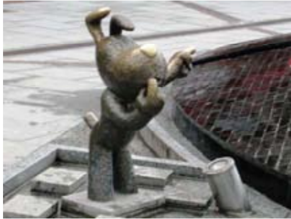
Ryc. 20 Pomnik-rzeźba Reksia