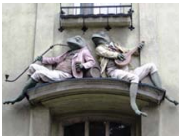
Ryc. 19 Dom Pod Żabami