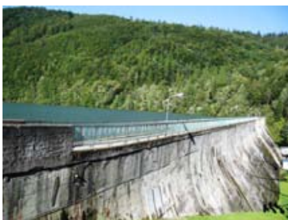
Ryc. 21 Zapora wodna w Wapienicy

Położona w Beskidzie Śląskim Dolina Wapienicy ma typowy górski krajobraz. Występująca tu roślinność jest charakterystyczna dla pięter pogórza, regla dolnego i górnego. Spośród popularnych w Beskidach zwierząt możemy spotkać jelenie, sarny, dziki i lisy, a także nietoperze, kuny czy gronostaje. 22 Idąc szeroką i piaszczystą drogą po półgodziny docieramy do betonowo- ziemnej zapory wodnej im. Ignacego Mościckiego ( Ryc. 21 ), która powstała w 1932 r. na rzece Wapienica. Znajdująca się w niej woda odpowiada I klasie czystości pod względem fizyko-chemicznym i bakteriologicznym. 23