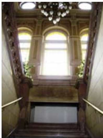
Ryc. 18 Ratusz – klatka schodowa

Na tym samym placu znajduje się miejski punkt Informacji Turystycznej, gdzie możemy uzyskać bezpłatnie plan miasta i mini przewodnik oraz uzyskać informacje na temat noclegów i wydarzeń kulturalnych, które obecnie się odbywają.