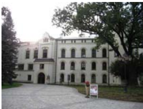
Ryc. 33 Stary Zamek w Żywcu – stan obecny

Przed naszymi oczami ukazuje się Stary Zamek w Żywcu ( Ryc. 33 ), obecna wizytówka miasta i perełka na opisywanym szlaku. Sam budynek powstał w połowie XIV wieku i posiada czworoboczną wieżę, którą wieńczy blanki (tzw. zęby), a jego historia i związane z nim losy są długie i barwne. Pierwszymi potwierdzonymi w źródłach właścicielami zamku, miasta oraz innych dóbr żywieckich zostali Komorowscy herbu Korczak, którzy wprowadzili w architekturze zamku akcent renesansowy, m.in. w postaci pięknego arkadowego dziedzińca określanego często małym Wawelem. Wsparty on jest od dołu na kolumnach toskańskich, na pierwszym piętrze jońskich, a na drugim opiera się na żeliwnych słupach wykonanych w XIX w. Zamkiem następnie władali Skrzyńscy, Wielopolscy i wreszcie Habsburgowie, a ostatecznie po zakończeniu II wojny światowej stał się własnością skarbu państwa. 42