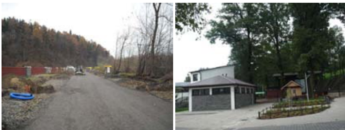
Ryc. 40 Żywiec – Amfiteatr w Grojcu – stan przed realizacją projektu