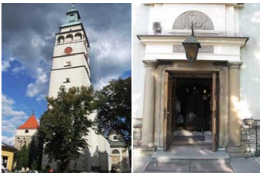
Ryc. 44 Konkatedra Narodzenia NMP w Żywcu

Opuszczamy zamek, park i pałac i udajemy się do Konkatedry Narodzenia NMP ( Ryc. 44 ). Obiekt sakralny zbudowany został w stylu gotyckim i renesansowym, a następnie rozbudowany i przerobiony w stylu barokowym i późniejszych. Główne wejście do świątyni znajduje się pod wieżą. Widnieje nad nim napis R.P. 1515 oraz płaskorzeźba z herbem rodziny Komorowskich – Korczak ( Ryc. 45 ). W środku znajdują się dwie kaplice grobowe: Komorowskich z końca XVI i początku XVII wieku oraz Habsburgów z 1929 r. Największym skarbem jest płaskorzeźba Zaśnięcie Matki Boskiej z 1500 r. Będąc w środku warto jeszcze zwrócić uwagę na późnobarokowe organy, ołtarz główny oraz ambonę. Obchodząc budowlę z zewnątrz możemy zobaczyć wmurowane w ścianę tablice upamiętniające Jana Kochanowskiego czy Piotra Skargę. 55