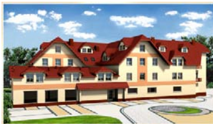
Ryc. 24 Hotel Skalite w Szczyrku

Oprócz tego goście mają do dyspozycji komfortowo i nowocześnie urządzone pokoje a spragnieni rozrywki turyści mogą pobawić się w klubie. Jest też możliwość zorganizowania konferencji i różnego rodzaju innych spotkań i uroczystości. Dodatkowym atutem jest atrakcyjne położenie oraz szeroka oferta gastronomiczna. 30 Rozbudowa tego ośrodka znacznie poszerzyła bazę noclegową Szczyrku, o luksusowe usługi, co może skutkować przyciągnięciem bardziej wymagających gości, także tych biznesowych. Wzrost liczby turystów jest dla miasta siłą napędową do dalszego rozwoju, dlatego inwestycja ta ma dla Szczyrku doniosłe znaczenie.