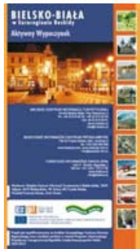
Ryc. 3 Mapa Bielsko-Biała w Euroregionie Beskidy (um.bielsko.pl 30.10.2010)

Ryc. 5 ) (60 km w Polsce i 100 na Słowacji) otwiera nowe możliwości w kontaktach międzynarodowych, szczególnie na płaszczyźnie turystyki rowerowej. Dzięki bardzo dobremu oznakowaniu trasy podróżowanie stało się bezpieczne i komfortowe, a także możliwe stało się dotarcie do wielu ciekawych miejsc. 6