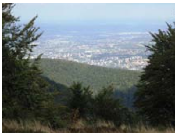
Ryc. 23 Klimczok – panorama

Ze szczytu roztacza się przed nami uroczy widok ( Ryc. 23 ).. Z lewej strony widzimy dzielnicę Bielska-Białej a w dole schronisko PTTK pod Klimczokiem, do którego udajemy się na odpoczynek. Odcinek ten prowadzi stromą ścieżką wzdłuż wyciągu orczykowego (wspaniale nadaje się do zimowych szaleństw na nartach lub snowboardzie).