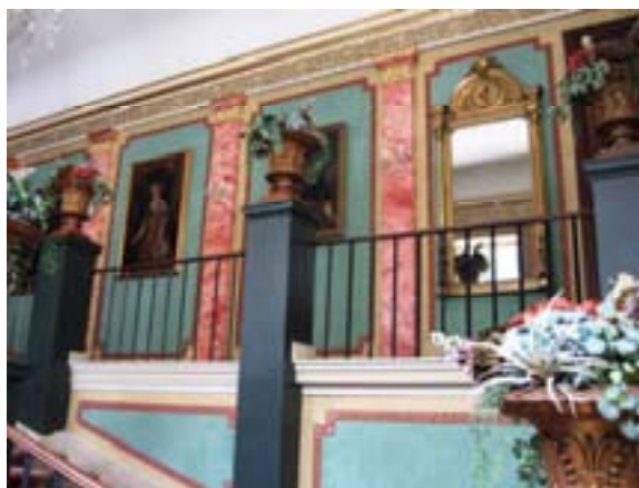
Ryc. 8 Westybul

Zwiedzając wnętrza zamku oprócz pięknych sal na uwagę zasługuje westybul ( Ryc. 8 ), czyli reprezentacyjna klatka schodowa łącząca parter z I pięciem. Po zwiedzeniu muzeum można udać się do zamkowej kawiarenki, gdzie w otoczeniu współczesnych dzieł sztuki i zabytkowych mebli można delektować się smakiem kawy lub herbaty.