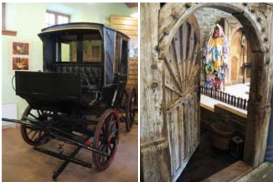
Ryc. 34 Muzeum Łowiectwa i Powozów w Żywcu

hodowle koni i ptaków w parkowym zamku. W tym celu wybudowano nowoczesną stajnię dla zwierząt. Zabytkowe oficyny zostały zaadaptowane na cele wystawiennicze Muzeum Miejskiego w Żywcu, stajnia na Muzeum Łowiectwa i Powozów ( Ryc. 34 ), wozownia na izbę regionalną ( Ryc. 35 ), a we wschodniej części budynku utworzono karczmę w stylu austro-węgierskim. 44