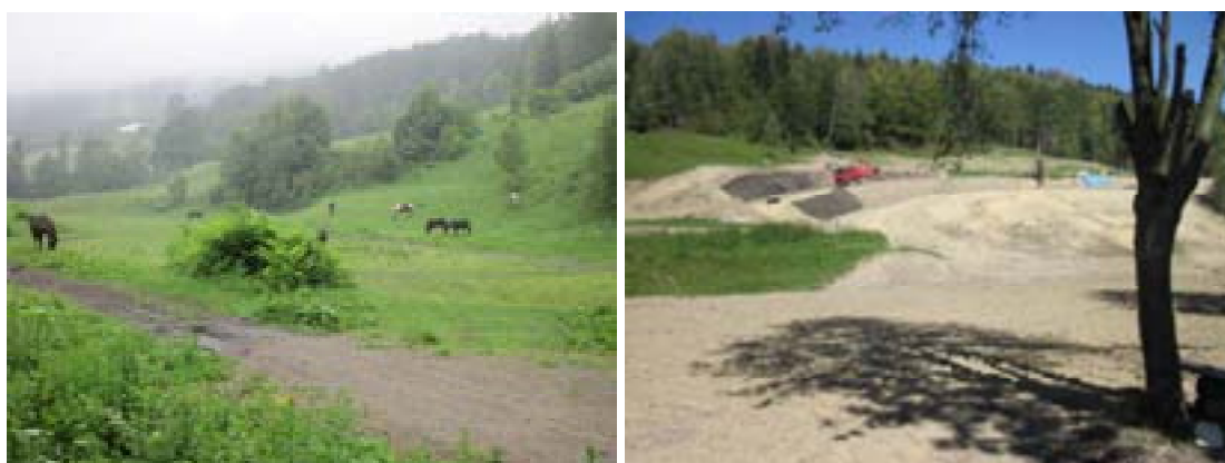
Ryc. 27 Centrum Rekreacji w Szczyrku – stan przed realizacją projektu I