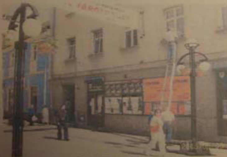
2. Część parterowa elewacji bocznej