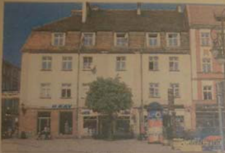
1. Elewacja frontowa